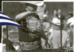
焼きたてのステーキをどうぞ