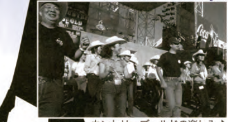
カントリーゴールドの楽しみ♪