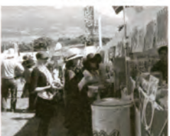
出店GOODSは掘り出しもの!