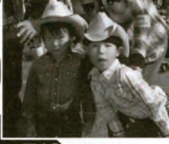
早く大きくなってネ。