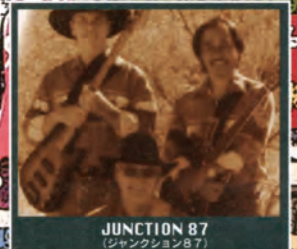
JUNCTION 87 (ジャンクション87)