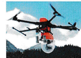
被害調査用ドローン