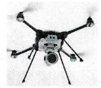
UAV(狭域用) スカイレンジャー