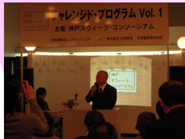
<花房取締役副本部長>