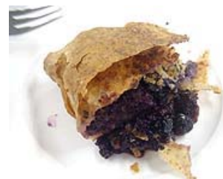
ウィーンの伝統菓子 ステュルユーデル